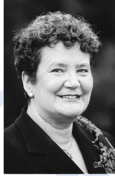
Prof. Dr. Ing. habil. Dagmar Schipanski Präsidentin der Deutschen Krebshilfe

Deutsche Krebshilfe, Thomas-Mann-Str. 40, 53111 Bonn E-Mail: deutsche@krebshilfe.de